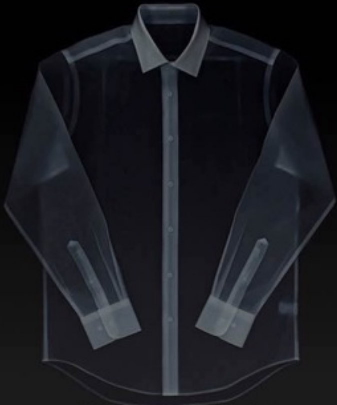
X光拍摄 白色部分为嵌条造影

量品定制衬衫接缝均使用嵌条工艺， 确保衬衫反复洗涤、揉搓后， 依然平整挺括，如刚熨烫过一样。